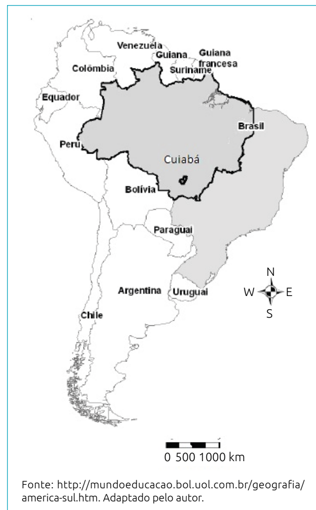
Figura 1 Localização da cidade de Cuiabá, MT, destacando a Região Amazônica.

Foi desenvolvido um estudo referente à internação de crianças menores de 10 anos de idade, exclusive, residentes na cidade de Cuiabá, capital do Estado de Mato Grosso, região Centro-Oeste do país, que conta com uma população de cerca de 600 mil habitantes, nas coordenadas 15^{\circ}36'S e 56^{\circ}5'O (Figura 1).