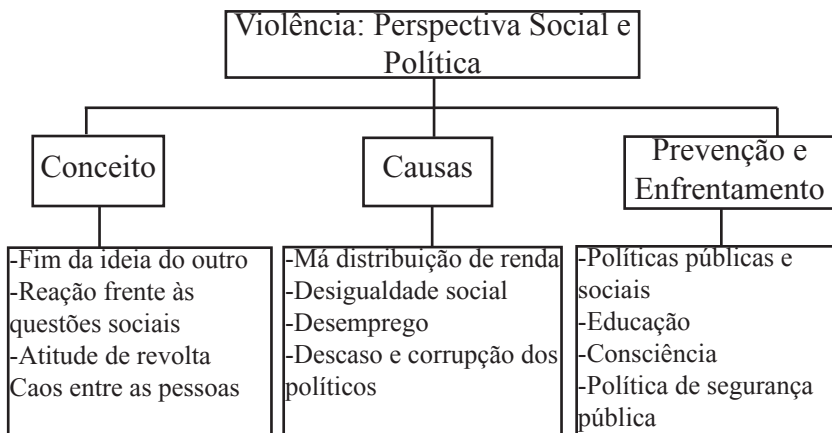
FIGURA 1 - CLASSE 1 - VIO-LÊNCIA/PERSPECTIVA SOCIAL E POLÍTICA

Conforme pode ser visualizado na figura1, a classe 1, denominada VIO-LÊNCIA: PERSPECTIVA SOCIAL E POLÍTICA é composta por três subclasses: conceito, causas e enfrentamento/prevenção.