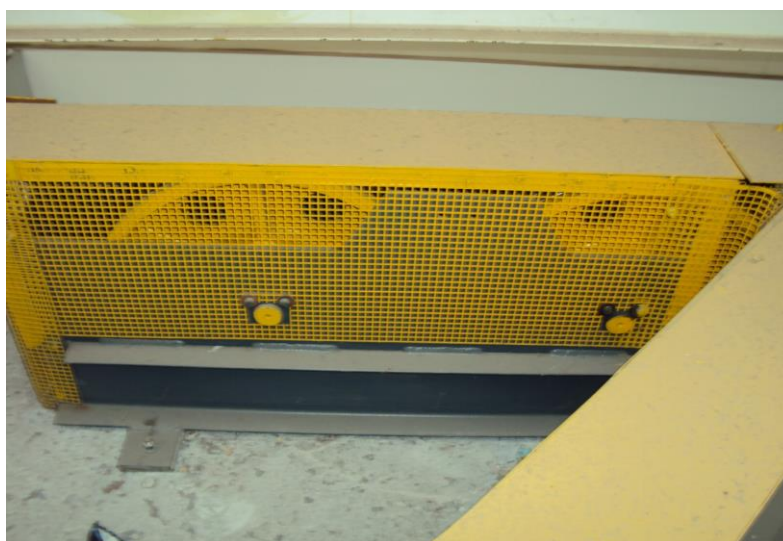
Figura 5 Proteção das polias de desvio