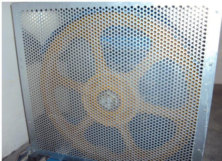
Figura 4 Proteção da polia de tração

As proteções usadas devem ser construídas de modo que as partes girantes sejam visíveis e não atrapalhem as operações de exame e manutenção. Se elas forem perfuradas, devem atender as recomendações da norma EN 294:1992. Tais proteções somente podem ser retiradas se houver a necessidade da troca dos cabos, troca de polia ou repasse de ranhuras.