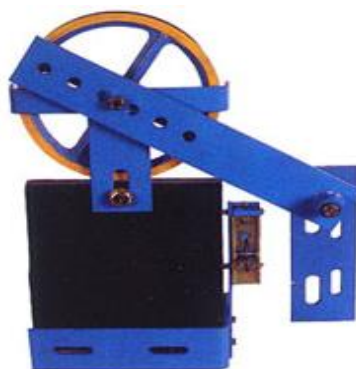
Figura 8 Polia Tensora