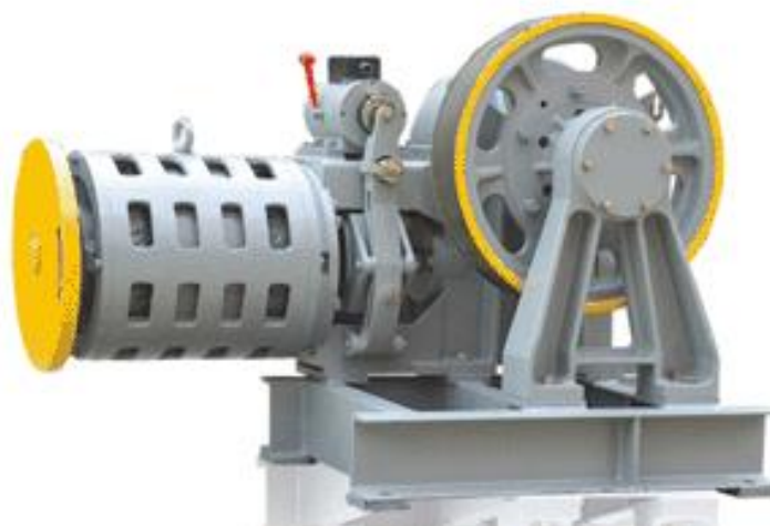
Figura 9 Máquina de tração

ser feita, por exemplo, colocando marcas nos cabos de tração ou no cabo do limitador de velocidade. Se o esforço definido supera 400 N, deve ser provido na casa de máquinas meio de operação elétrica de emergência (ABNT NBR NM 207, 1999).