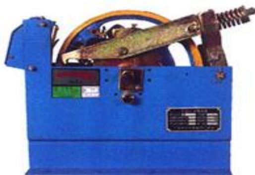
Figura 7 Limitador de velocidade

O limitador de velocidade deve ser acionado por um cabo de aço projetado para esta finalidade e sua carga de ruptura deve estar em função do esforço que será produzido neste cabo no momento de sua atuação considerando um coeficiente de segurança mínimo de oito. Tais cabos devem possuir diâmetro nominal mínimo de seis milímetros. A razão entre o diâmetro nominal da polia do limitador de velocidade e o diâmetro nominal do cabo deve ser de pelo menos trinta. Tal cabo deve ser tensionado por uma polia tensora cujo movimento deve estar restrito a um plano vertical (ABNT NBR NM 207, 1999).