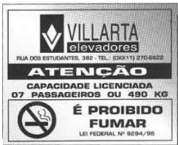
Figura 3 Placa indicativa de capacidade

elevada. Também são desconhecidas as consequências advindas da inobservância de algo tão simples que vão desde a morte de pessoas, passando pelo esmagamento de membros e passando invariavelmente por perdas do patrimônio e danos a produção. Todos os equipamentos devem ser sinalizados quanto a sua capacidade em local visível.