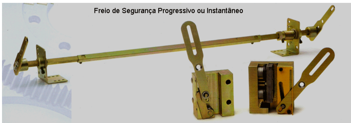
Figura 6 Modelos de freios de segurança

Os freios de segurança do carro e do contrapeso devem ser acionados pelo seu próprio limitador de velocidade, e é proibido o acionamento de freios de segurança por dispositivos elétricos, hidráulicos ou pneumáticos.