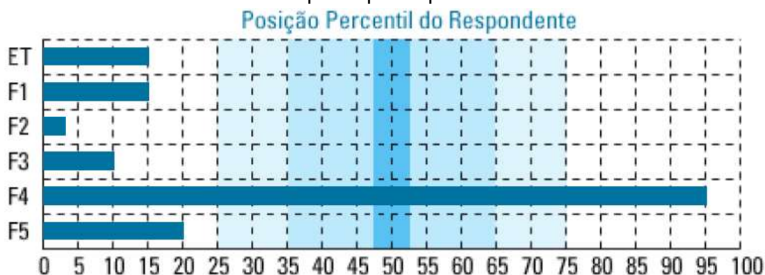
Gráfico 2 – Resultados do IHS do participante por Percentis