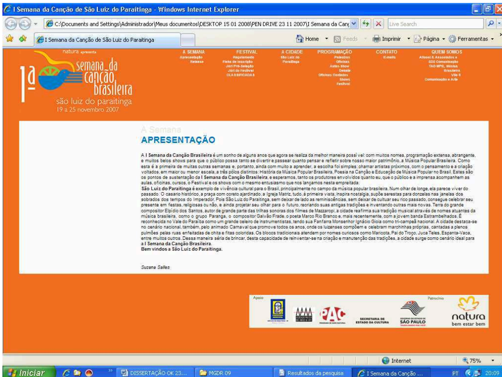
Figura 4 – Semana da Canção Brasileira em São Luiz do Paraitinga