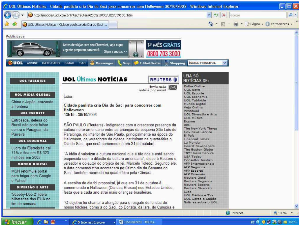
Figura 3 – Dia do Saci