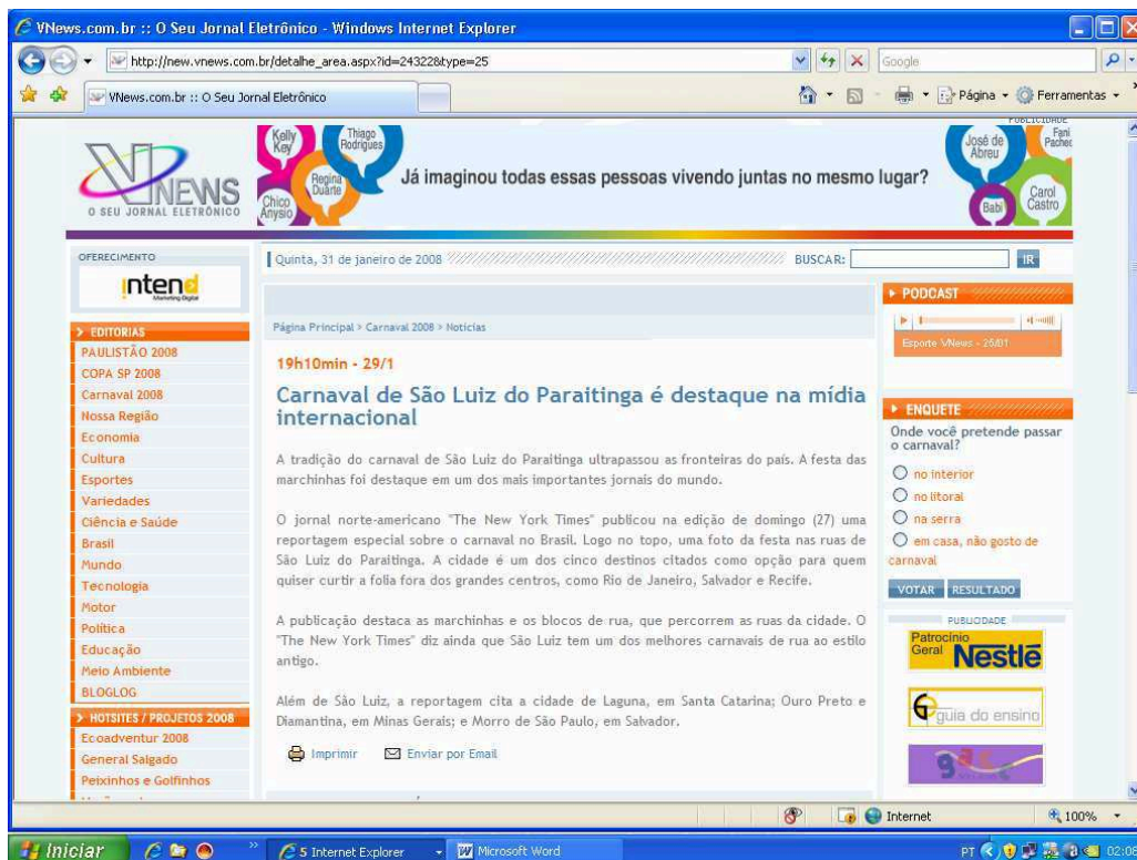
Figura 2 – São Luiz do Paraitinga no New York Times 2