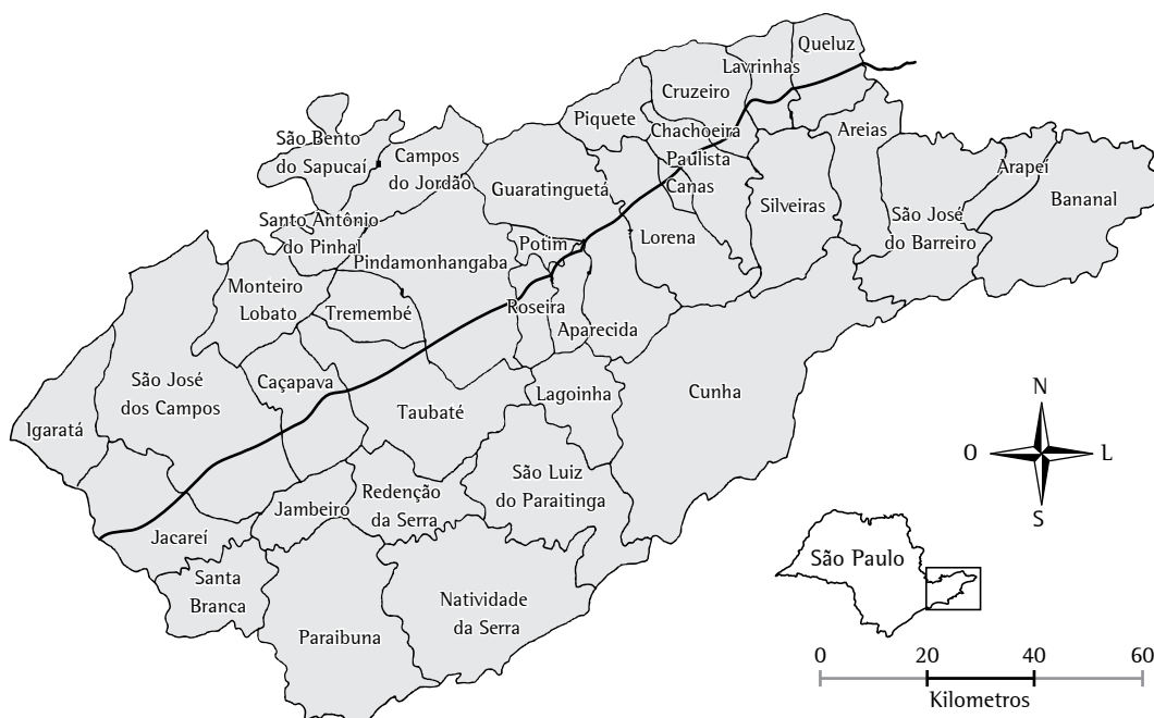
Figura 1 – Municípios do Vale do Paraíba (SP).

no primeiro quadrante, indicando alta prioridade na intervenção em virtude de terem altas taxas e de seus vizinhos também apresentarem altas taxas de internação por pneumonia. O diagrama de Moran determina a localização de cada município em um dos quatro quadrantes: quadrante 1, alto-alto, quando o município tem alta taxa e é cercado por municípios com altas taxas; quadrante 2, -baixo-baixo, quando o município tem taxa baixa e é cercado por municípios com baixas taxas; quadrante 3, alto-baixo, quando o município tem alta taxa e é cercado por municípios com baixas taxas; e quadrante 4, baixo-alto, quando o município tem baixa taxa e é cercado por municípios com altas taxas.