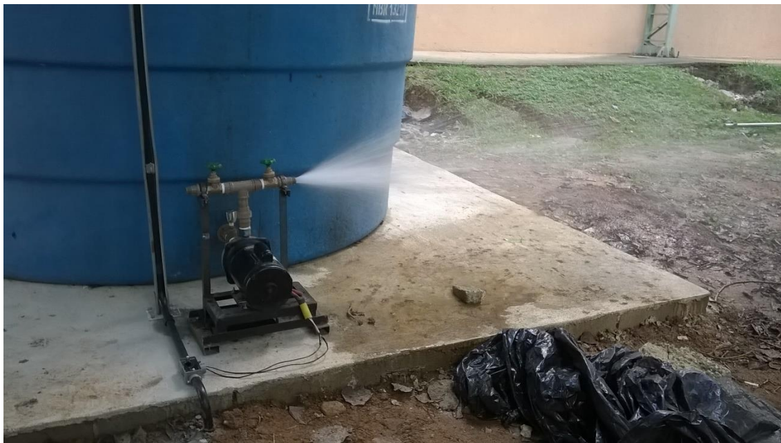
Anexo 7. Botoeira liga/desliga.