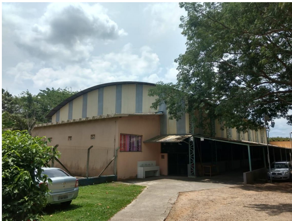
Anexo 3. Telhado do ginásio esportivo FUNDHAS.