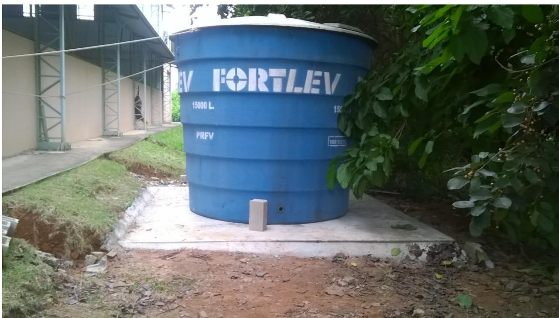
Anexo 2. Base de concreto com reservatório.