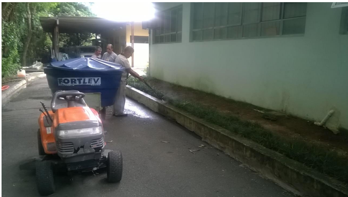
Anexo 8. Utilizando reservatório móvel.