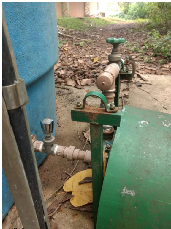
Anexo 10. Registro da cisterna.