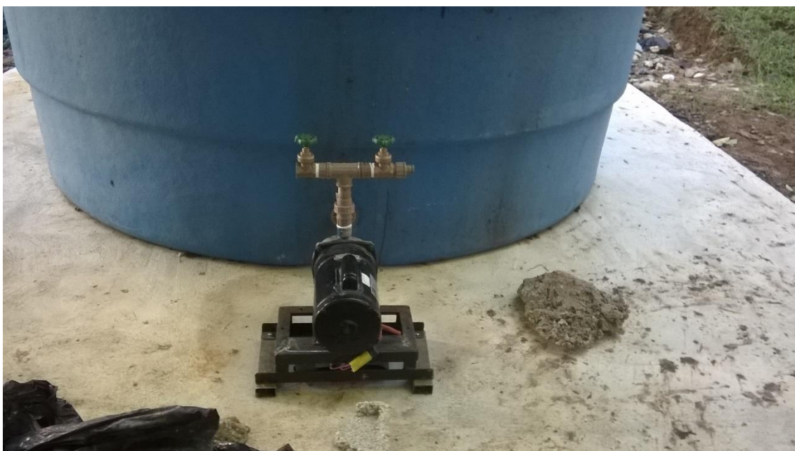
Anexo 5. Montagem registro do reservatório.