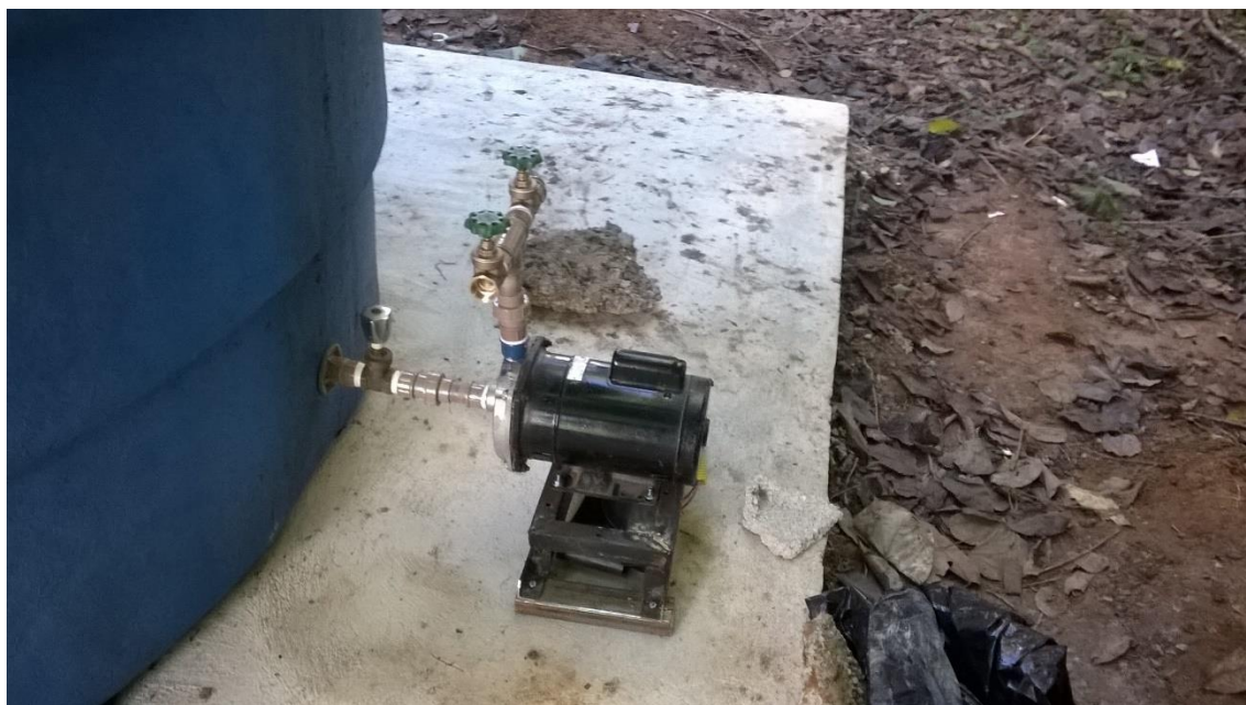
Anexo 4. Bomba para pressurização do sistema.