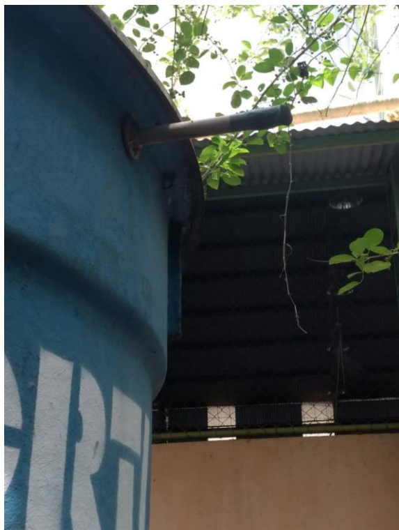
Anexo 9. Ladrão.