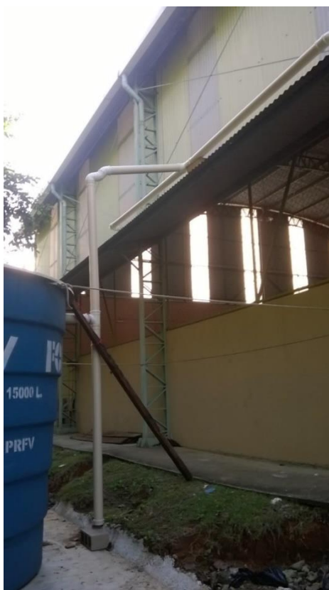
Anexo 6. Detalhes do descarte da primeira água.