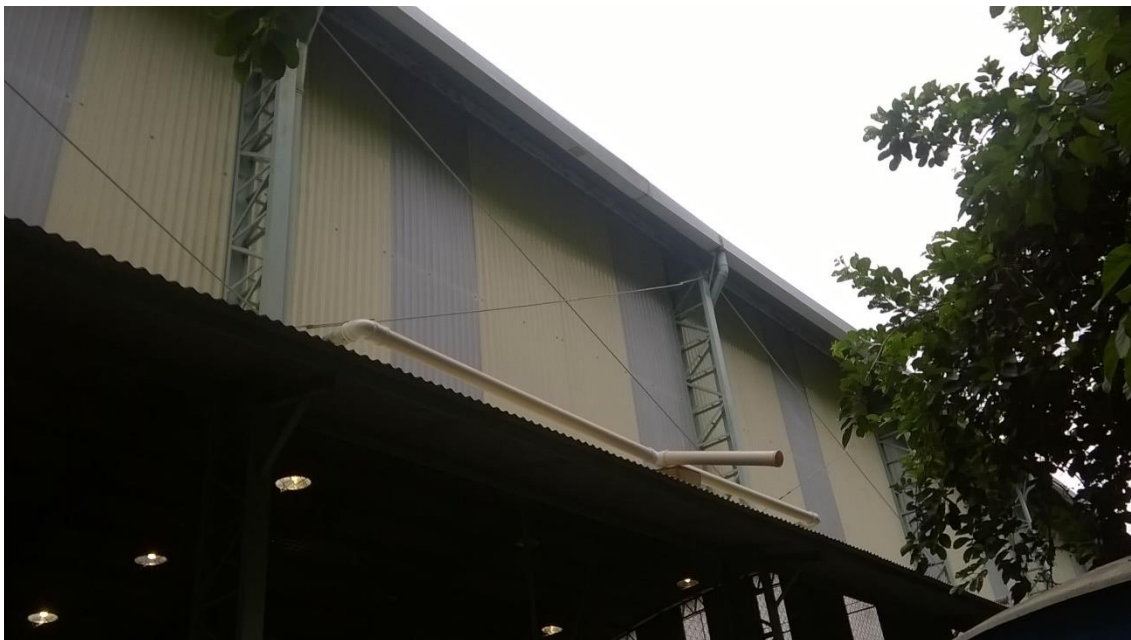
Anexo 1. Montagem serviços hidráulicos.