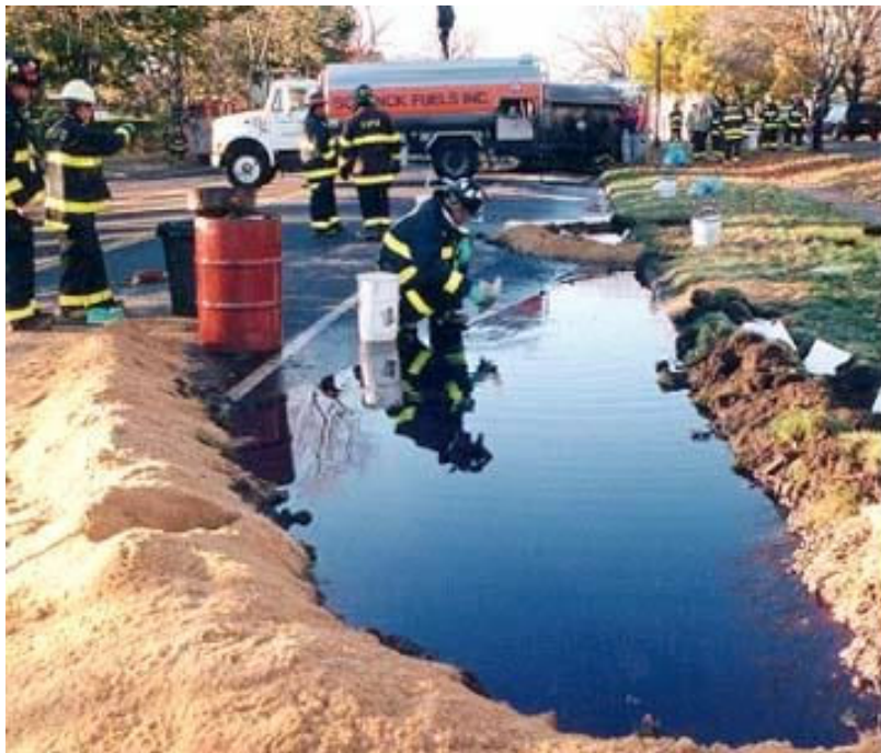
Figura 6 Vazamento com produtos perigosos.