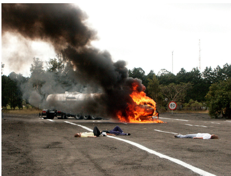
Figura 4 Simulado de acidente com produtos perigosos.