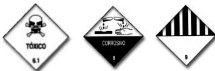
Figura 2 Rótulo de risco.

Os rótulos de risco têm a forma de um quadrado, apoiado sobre um de seus vértices, com dimensões mínimas de 100mm por 100mm, com uma linha da mesma cor do símbolo, a 5mm da borda e paralela a seu perímetro. Podem ser usados rótulos menores em embalagens que não comportem os rótulos estipulados, sempre que as exigências específicas permitirem o uso de embalagens com dimensões inferiores a 100mm de lado.