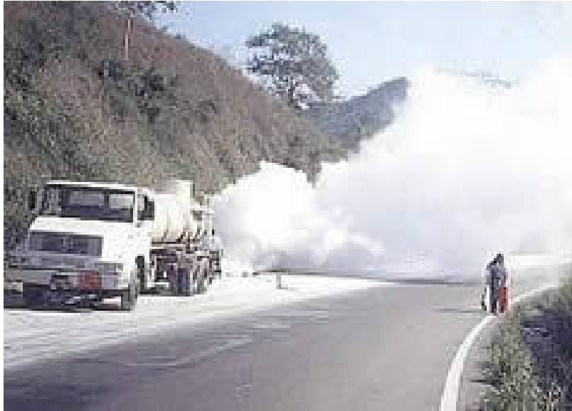
Figura 5 Vazamento com produtos perigosos.