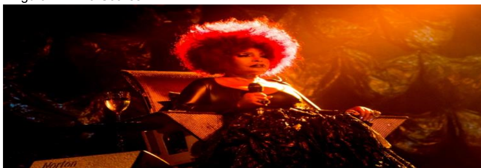
Figura 1 - Elza Soares