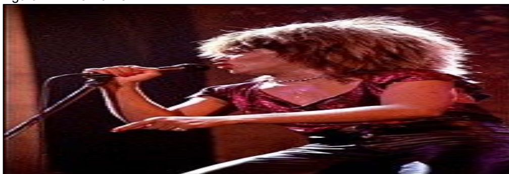
Figura 4 - Tina Turner