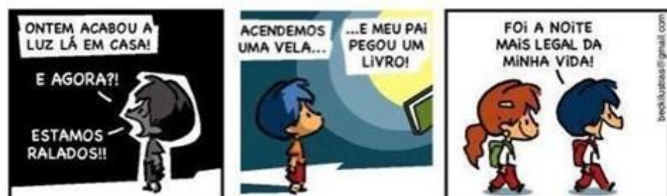
FIGURA 6 – TEXTO III