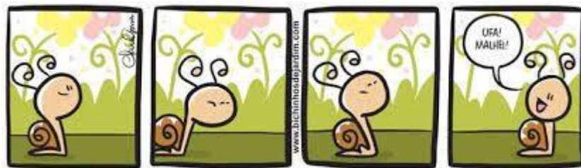
FIGURA 4 – TEXTO I

FONTE: GOMES; Clara. Bichinhos de Jardim: histórias mequetrefes.