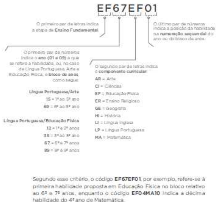
FIGURA 2 – NOMENCLATURA

Junto das competências, as habilidades são apresentadas para atingi-las, como ações relacionadas a um ou mais objetos de conhecimento que dialogam com as competências da disciplina e as competências gerais. São apresentadas através de códigos e iniciadas com verbos que indicam seu processo cognitivo.