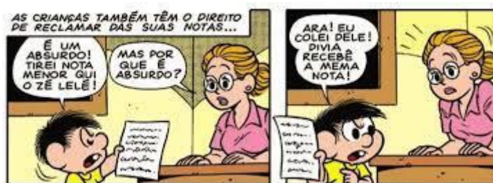
FIGURA 3 – TIRINHA INTRODUTÓRIA

A primeira atividade seria mais focada para um contexto geral de apresentação da tirinha para os alunos. Neste primeiro contato, deixar com que eles explorem todos os recursos verbais e não verbais presentes no texto, comentem entre si sobre a tirinha proposta. Aqui o enfoque é no gênero trabalhado, a tirinha, envolvendo a leitura, os efeitos de sentido do humor e a produção multissemiótica.