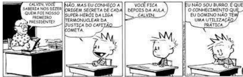
FIGURA 5 – TEXTO II

FONTE: WATTERSON, Bill. O melhor de Calvin.