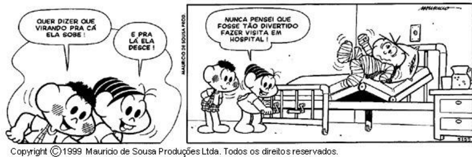
FIGURA 8 – PRODUÇÃO DE TEXTO