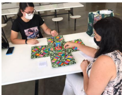
Acervo dos autores, 2021