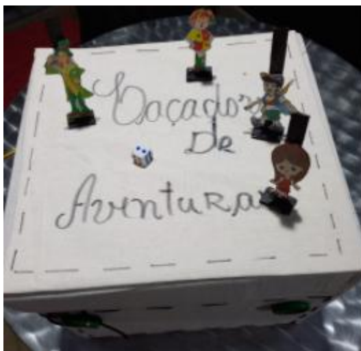
Acervo dos autores, 2021

Dentre as questões mais delicadas que enfrentamos, estava em nomear o jogo, depois de muitas possibilidades optamos por Caçadores de Aventura, principalmente por considerar as características presentes no enredo das histórias e personagens de Lobato.