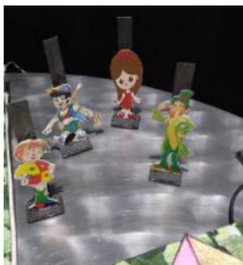
Acervo dos autores, 2021

O jogo terá como pinos os principais personagens das histórias de Lobato : Emília, Narizinho, Pedrinho e Visconde, para que a criança possa escolher qual personagem ela mais se identifica ou gosta para representá-lo no jogo. Contaremos também com um dado para que ao longo do jogo seja determinado quantas casas cada jogador andará e quem começa jogando.