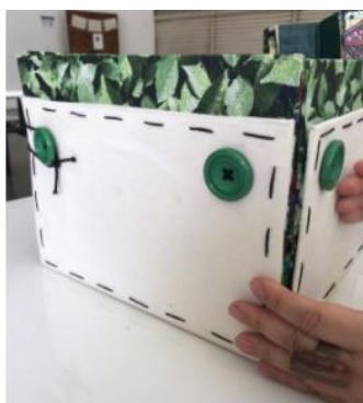
Acervo dos autores, 2021