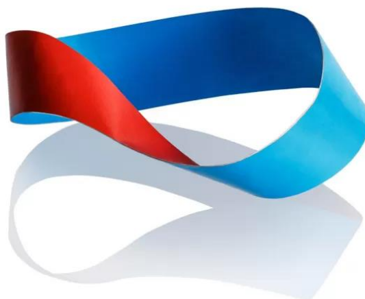
Figura 1: Fita de Moebius.