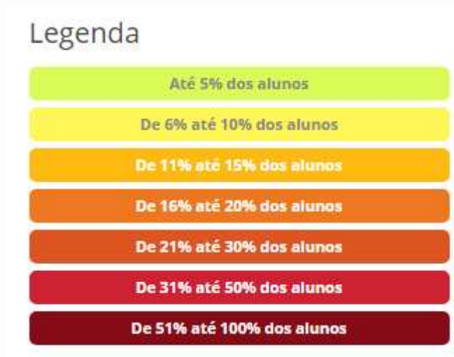
Gráfico 2 - Dados do Inep sobre distorção idade-série na zona rural em 2018 no Município de São Luiz do Paraitinga