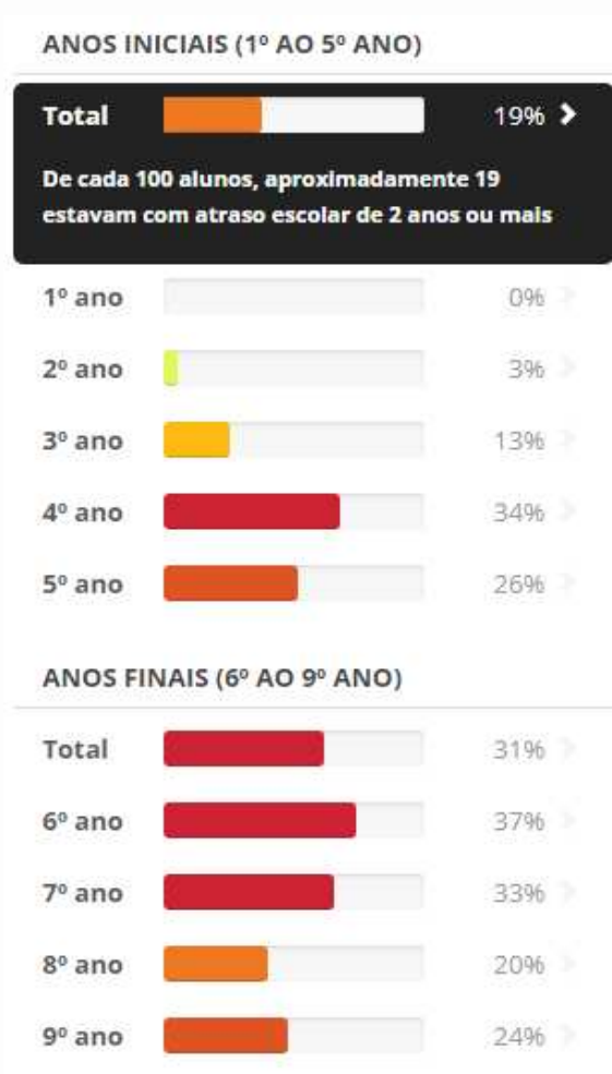
Gráfico 1: Dados do Inep sobre distorção idade-série na zona rural em 2006 no município de São Luiz do Paraitinga

Ao levantar dados do município em relação à educação, segundo o Censo Escolar, o Ideb da cidade era de 4,2, em 2007, sendo os índices de retenção, de evasão escolar e da distorção idade série, os principais responsáveis pelo baixo rendimento, segundo observamos nos dados do Censo Escolar (BRASIL, 2007). Esses dados revelam a situação da educação municipal naquele ano, todavia, cinco anos após a abertura de grande parte dos núcleos escolares, observamos que o Ideb subiu de 4,2 para 4,6, tendo o fluxo de 0,87%, ou seja, de cada 100 alunos, 13 não foram aprovados ou se encontravam evadidos da escola. Nota-se que esse indicador foi diminuindo gradualmente e mostrou melhoras significativas a partir de 2011, quando o município apresentou fluxo de 0,92%, o que indica que a cada 100 alunos 8 não foram aprovados ou se encontravam evadidos. Esses dados apresentados pelo Censo Escolar mostram a realidade do município como um todo, porém, em relação à distorção idade-série, o Inep (2006) aponta altos índices das escolas ditas de zona rural, como mostram os gráficos abaixo: