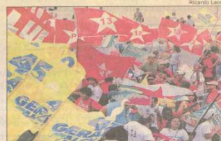
TUCANOS E petistas se encontram em passeata na orla da Zona Sul

• A Polícia Federal já identificou, em Duque de Caxias, na Baixada Fluminense, a corretora de câmbio de onde saíram os US$ 248,8 mil que seriam usados por petistas para comprar um dossiê contra tucanos. Na corretora foram feitos vários saques, somando US$ 249,9 mil — a diferença de valor seria referente a taxas pagas à corretora. Os saques foram feitos por laranjas, pessoas de origem humilde cujos nomes foram usados para retirar o dinheiro. Os sócios da corretora e os sacadores serão chamados a depor. Página 3