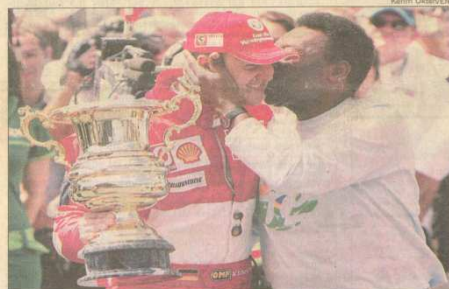
SCHUMACHER RECEBE UM troféu e um beijo do Rei Pelé: homenagem a um mito da F-1

Massa vence a prova; Alonso é bicampeão; e Schumacher dá adeus