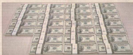
NOTAS EM DÓLAR: US$ 248 mil saíram de Miami e entraram legalmente no Brasil por um banco de SP