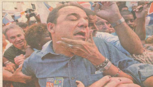
NO BRACÇO DO POVO: em caminhada na Baixada, Sérgio Cabral é agarrado, espremido e empurrado por eleitores mais afoitos

Acusações e xingamentos marcaram a maioria dos debates entre candidatos a governador realizados antontem pela Rede Globo nos dez estados onde há segundo turno. No Paraná, Roberto Requião (PMDB) e Osmar Dias (PDT) se chamaram de mentirosos e hipócritas. No Pará, a maior discussão entre Almir Gabriel (PSDB) e Ana Júlia (PT) foi sobre o apoio político do deputado Jader Barbalho (PMDB), acusado de envolvimento no escândalo da Sudam. No Rio Grande do Sul, o clima entre Yeda Crusius (PSDB) e Olívio Dutra (PT) esquentou no debate sobre as finanças do estado. No Maranhão, onde o Ibope registrou empate entre Roseana Sarney (PFL) e Jackson Lago (PDT), com 50% dos votos válidos, surgiram novas denúncias de compra de votos. Na Paraíba, fiscais da Justiça Eleitoral apreenderam R$ 320 mil atirados pela janela de um edifício. Páginas 26 a 30