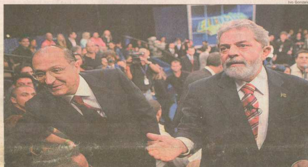
ME DÁ UM VOTO AL: Antes do início do debate na TV Globo, ontem à noite, Geraldo Alckmin (PSDB) e Luiz Inácio Lula da Silva (PT) pedem votos a eleitores indecisos levados ao estúdio pela emissora.

Na Paraíba, R$ 320 mil em dinheiro vivo são jogados pela janela de edifício