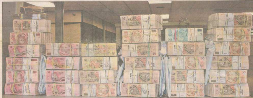
IMAGENS DO R$ 1,7 MILHÃO que seria usado por petistas para comprar um dossiê contra tucanos: as fotos foram feitas anteriormente, durante a pericia do dinheiro na Polícia Federal

• Duas semanas depois da apreensão de R$ 1,7 milhão com petistas num hotel de São Paulo, apareceram as fotos das cédulas, cuja divulgação fora proibida pela Polícia Federal e pelo Ministério da Justiça. A PF não liberou oficialmente as fotos, mas confirmou que elas são autênticas e foram feitas anteriormente, durante a pericia das notas. As imagens mostram montes de dinheiro, em reais e dólares, divididos em pacotes. A dois dias das eleições, a imagem acirrou a guerra entre governo e oposição: o PT recorreu ao Tribunal Superior Eleitoral para tentar impedir a publicação das fotos, mas o pedido foi rejeitado. O ministro das Relações Institucionais, Tarso Genro, acusou o PSDB de ter patrocinado a divulgação das imagens. O PSDB nega envolvimento com o caso. A PF abriu sindicância para apurar quem da instituição distribuiu as imagens. O inquérito corre em segredo de Justiça. A suspeita recaiu sobre o delegado Edmilson Bruno, que apreendeu o dinheiro e prendeu os petistas, mas está hoje fora das investigações. Bruno nega e alega que um CD com as fotos foi furtado de sua sala. Páginas 3 a 14