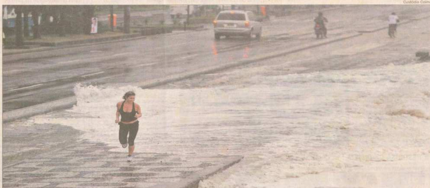
• MULHER CORAGEM: Uma mulher enfrenta o frio e a água do mar, que chegou ontem até a ciclovia do Leblon, no Posto 11. A ressaca com ondas de até 3,5 metros veio com o mau tempo. O dia foi o mais frio do ano, com mínima de 10,6 graus no Alto da Boa Vista. Página 22

Na segunda entrevista do GLOBO com candidatos ao governo do Rio, Milton Temer (PSOL) disse que os investimentos que o Rio precisa podem vir da cobrança da dívida de R$ 36 bilhões de créditos que o estado tem com sonegadores. Hoje é a vez de Eduardo Paes (PSDB). Páginas 16 e 17